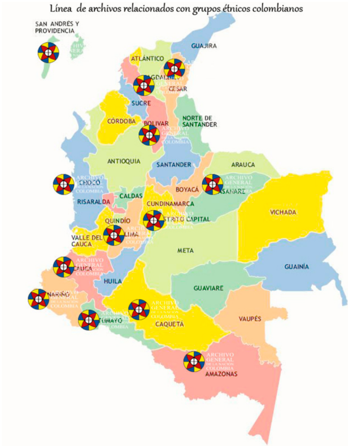
Mapa 1. Lugares en los que el AGN ha desarrollado acciones relativas a la conformación, protección y conservación de archivos relacionados con grupos étnicos.