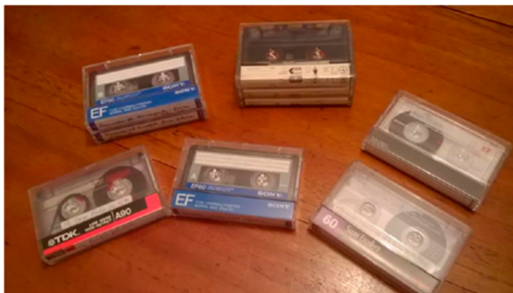
Fotografías 14 y 15. Colección sonora Juan de la Cruz Varela y la provincia del Sumapaz. Rocío Londoño botero