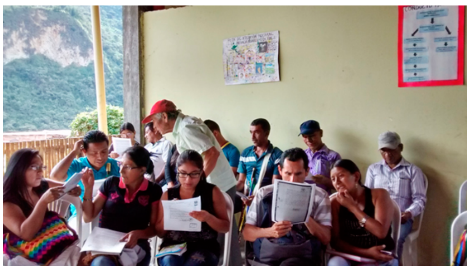
Fotografías 2 y 3. Capacitación en Posibles Usos de los Documentos Históricos. Cabildo Indígena de Belalcázar, Páez, Cauca. 18 de agosto de 2017. Fotografías tomadas por servidores públicos del Grupo de Archivos Étnicos y Derechos Humanos.

A la fecha el AGN ha culminado su intervención en los Planes Integrales de Reparación Colectiva del Consejo Comunitario Los Cardonales de Guacoche y del Proyecto Nasa (que también comprende los resguardos nasas de Toribío, Tacueyó y San Francisco). En este momento el AGN continúa su participación en los Planes Integrales de Reparación Colectiva de los resguardos de Pitayó, Kisgó y Kitek Kiwe.