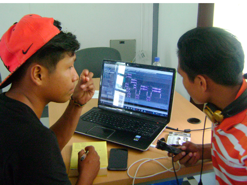
Fotografía 11. Encuentro de Formación en Comunicación Propia y Apropiada para Jóvenes Comunicadores indígenas, Leticia - Amazonas 16 de Junio de 2017.

De esta manera, los acervos fotográficos,