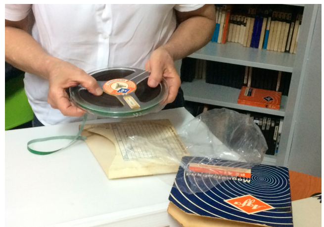
Fotografía 1. Visita de Asistencia Técnica AGN al Instituto Popular de Cultura Cali - Valle del Cauca 2018.

Bajo estas premisas, el Archivo General de la Nación, en cumplimiento de sus funciones, ha venido adelantando procesos de interlocución con algunas comunidades pertenecientes a grupos étnicos, encaminados a configurar escenarios para promover y acompañar la conformación, conservación y protección de sus propios archivos. Con ello el AGN pretende aportar a estas comunidades los elementos que, desde sus particulares necesidades e intereses, consideren relevantes y útiles para sus procesos de consolidación étnica y cultural, proporcionando herramientas básicas para un adecuado manejo de su documentación, especialmente aquella relacionada con la conservación de su cultura, su memoria y la defensa de sus derechos.