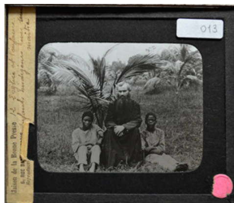
Fotografía 13. 12 L'Eglise et l'enfance. Enfants indigènes avec leur maître. Colección Diapositivas en vidrio Escuela Tecnológica Instituto Técnico Central.

Por su parte, la Beca de gestión de archivos sonoros de Colombia busca apoyar la preservación, conservación y circulación de colecciones sonoras nacionales, privadas o institucionales, de sonido inédito o editado, que por la vulnerabilidad de sus soportes originales (cintas magnéticas, discos de vinilo, cilindros de cera, etc.) o por el fallecimiento de sus propietarios, tenedores o custodios, se encuentren en riesgo de desaparecer. Esta beca inició en el 2015 y hasta el 2018 se han apoyado siete proyectos de colecciones sonoras con contenido de gran importancia para la historia de Colombia, los cuales podrán ser consultados muy pronto a través del portal web del Archivo General de la Nación.