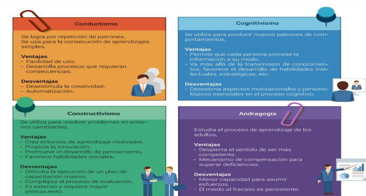
Ilustración 1 Guía metodológica del Plan Nacional de Formación y Capacitación