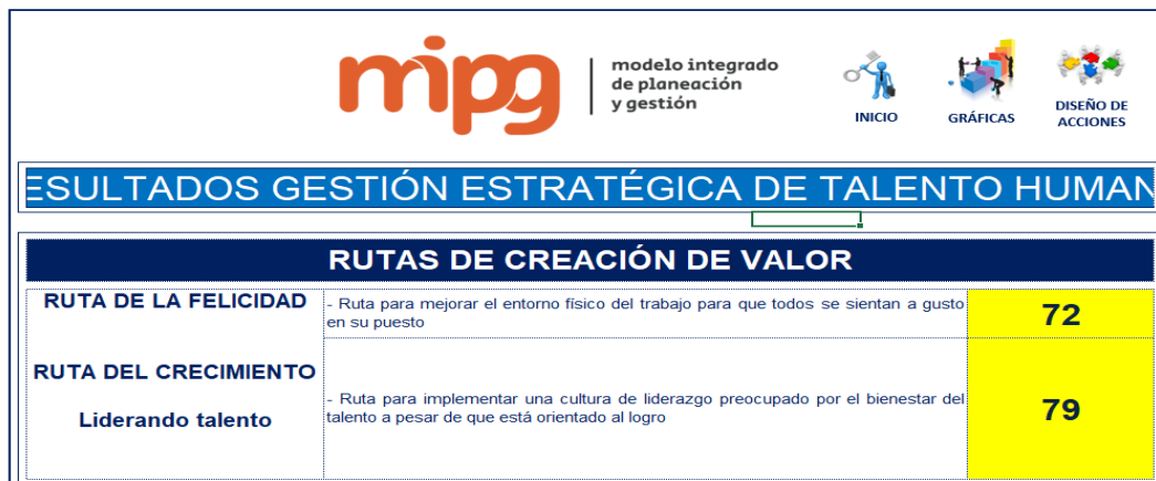
Tabla 1. Autodiagnóstico MIPG. Rutas de creación de valor.