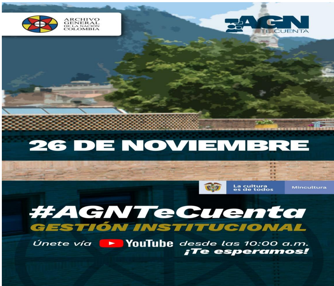
Imagen 1. Banner publicitario