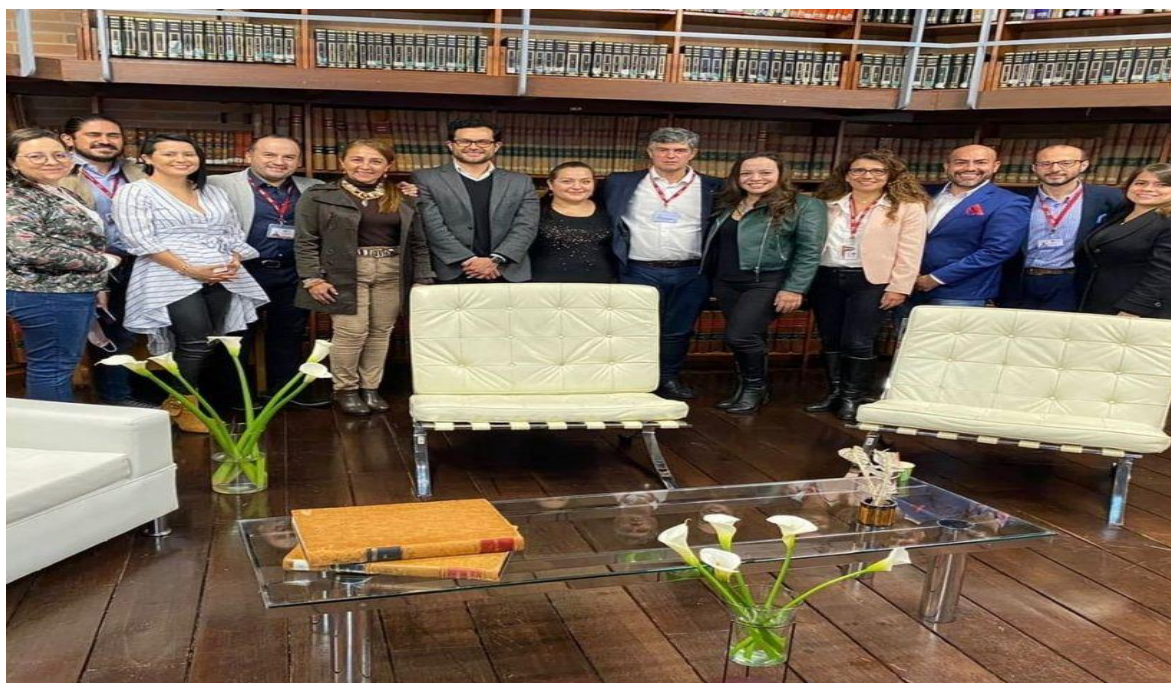
Imagen 3. Equipo directivo y asesor en la Biblioteca especializada del Archivo General de la Nación

Desde la Oficina Asesora de Planeación, se desarrolló el liderazgo mediante la formulación de la estrategia, la elaboración del guion y articulación con todas las dependencias. La estrategia fue enfocada en una rendición de cuentas con lenguaje claro, y técnico, se le brindó de forma clara la información y los resultados obtenidos en la ejecución y la administración de la entidad. Adicionalmente, se dispuso de un escenario acorde con la misionalidad de la entidad de gran valor patrimonial como lo es la Biblioteca especializada del Archivo General de la Nación.