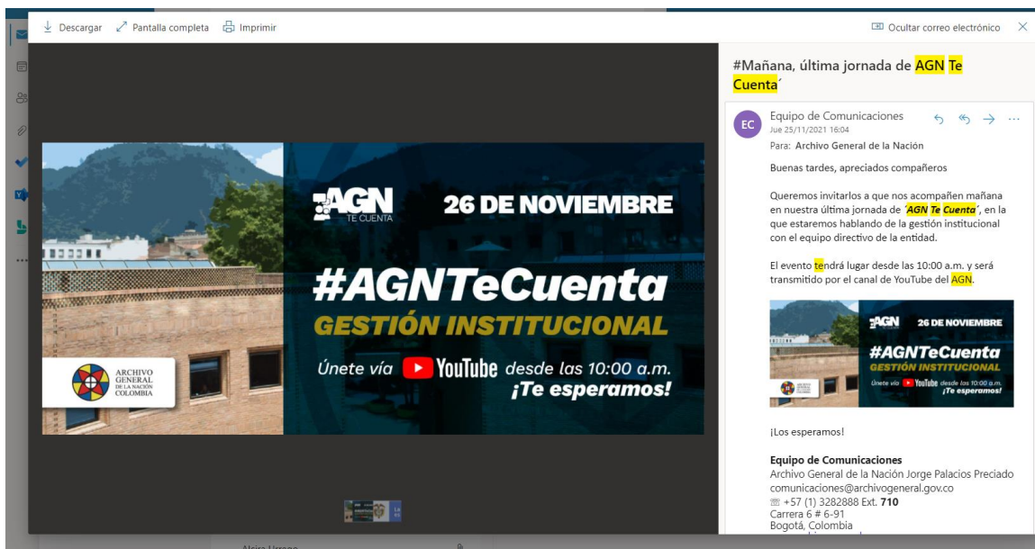
Imagen 2. Invitación interna a la rendición de cuentas