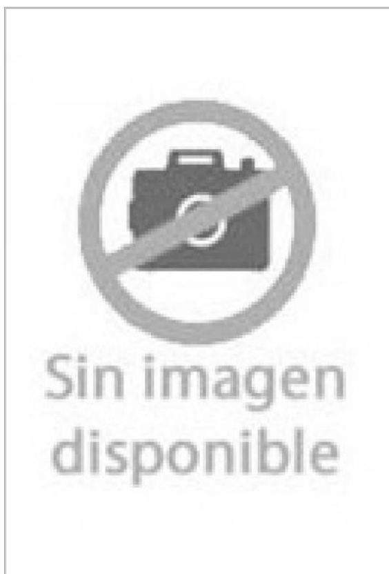
Imágen: Vista General