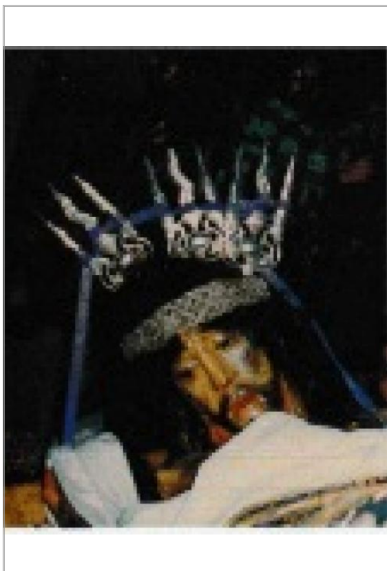
Imágen: Vista General